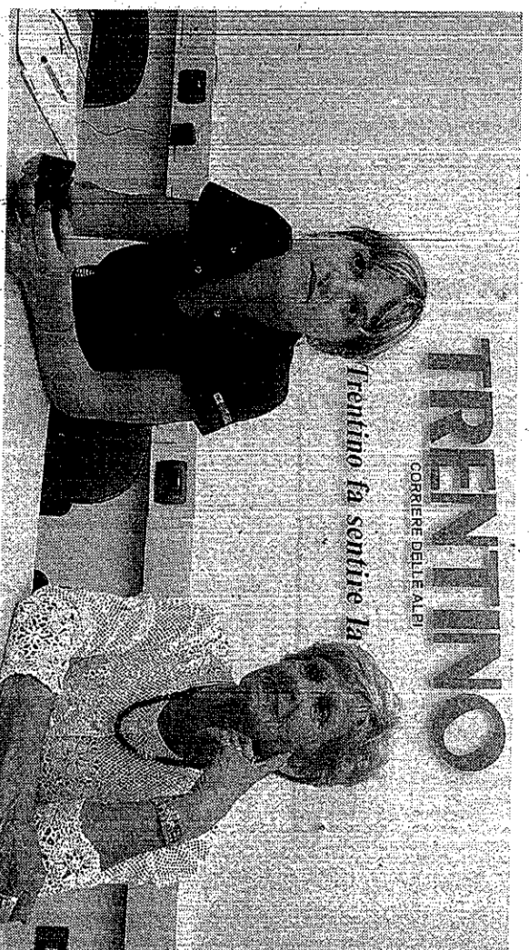
TRENTINO CORRIERE DELLA ALPI Trentino fa sentire la